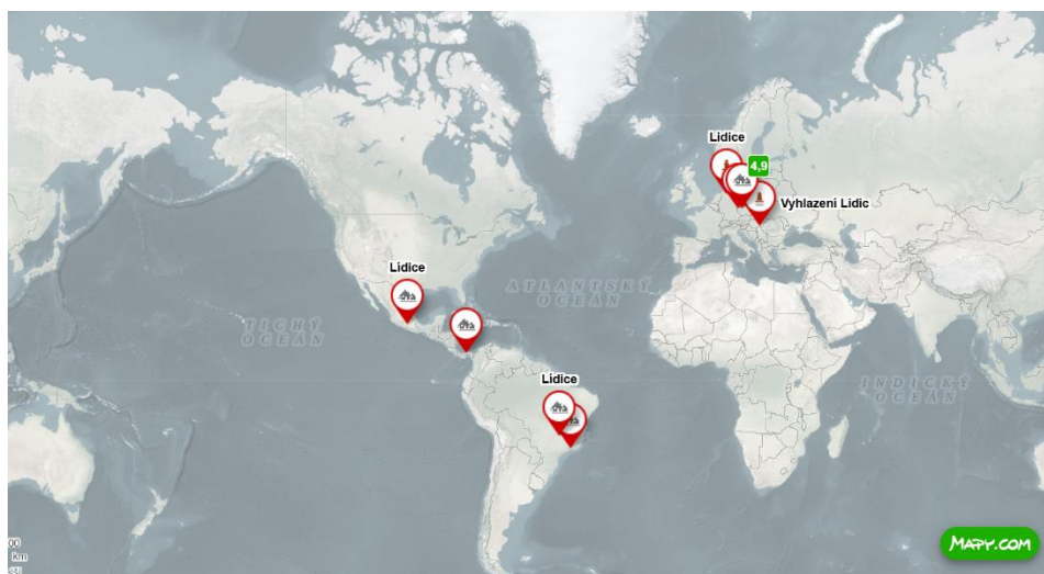
Mapa obcí pojmenovaných po Lidicích ve světě.

Odkaz na web Památníku Lidice – informace k jednotlivým přejmenovaným obcím: