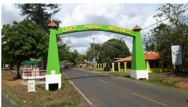
Zdroj: Česká ambasáda v Bogotě, dostupné z: https://mzv.gov.cz/bogota/es/sobre_la_embajada/archivo/archivo_2017/el_embajador_de_la_republica_checa_2.html