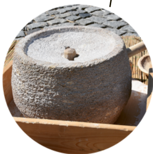
rotační mlýn na obilí