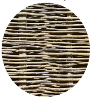
stěna vypletená proutím