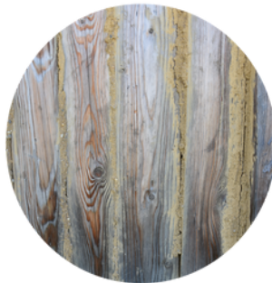
mazanici utěsněné spáry ve stěnách